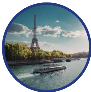
Sena $30 USD