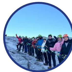
Glaciar $150 USD

**Precios de los tours opcionales son estimados al precio actual, podría tener algún cambio