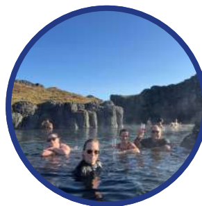
Sky Lagoon $160 USD