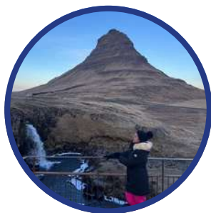
Peninsula $150 USD