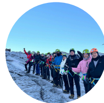
Glaciar $165 USD

**Precios de los tours opcionales son estimados al precio actual, podría tener algún cambio en FEBRERO 2027**