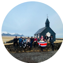
Peninsula $150 USD