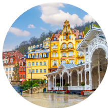
Karlovi Vary $100 USD