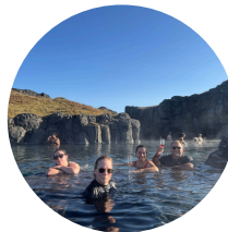
Sky Lagoon $160 USD